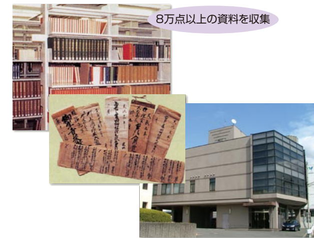
8万点以上の資料を収集