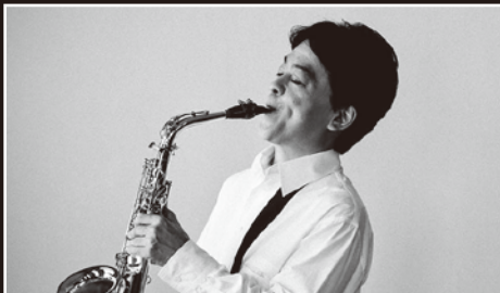
サクソフォン：須川 展也 Saxophone : Nobuya Sugawa