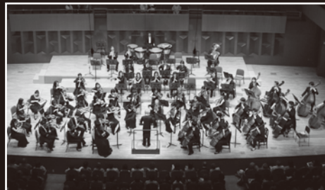
管弦楽：大阪交響楽団 Osaka Symphony Orchestra

早稲田大学第一文学部卒業。桐朋学園大学を経てウィーン国立音楽大学指揮科に学ぶ。97年、イタリア・シエナのキジアーナ音楽院よりフランコ・フェラーラ大賞を授与され、1年間ロンドン・コヴェントガーデン、ミュンヘン・フィル等で研鑽を重ねる。2000年、ミロブローロス国際指揮者コンクール優勝。これまでに数多くの国内オーケストラとともに、フェニーチェ歌劇場管、サンクト・ペテルブルグ・フィル、ウィーン室内管、イギリス室内管を始め、ヨーロッパ各国のオーケストラへ客演している。大阪交響楽団とは、2004年1月の正指揮者就任以来緊密な関係を続けている。同楽団常任指揮者。ウィーン在住。