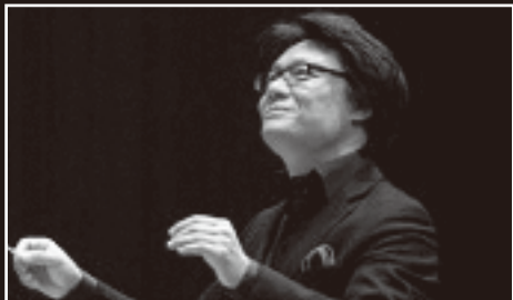
指揮者：寺岡 清高 Conductor : Kiyotaka Teraoka