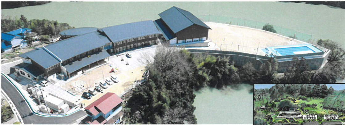
十津川村立 十津川第二小学校