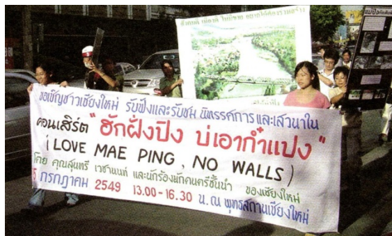
ピン川コンクリート堤防反対運動

チェンマイは約700年前よりランナー・タイ王国の建設から始まる歴史と伝統文化を有する古都であるが、近年は都市の膨張が加速的に増し、多くの自然環境や景観破壊が進みつつある。