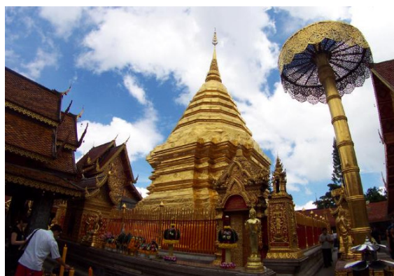
チェンマイの神奈備、ドイステープ寺院