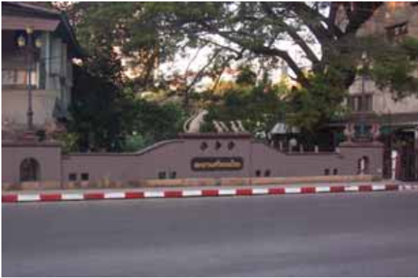
มุมมองสะพานข้ามคลองแม่ข่า