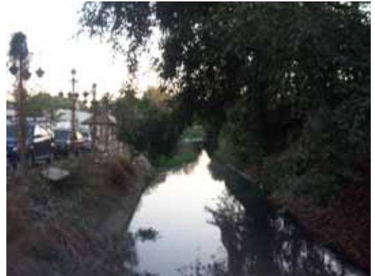
สภาพของลำน้ำในคลองแม่ข่า