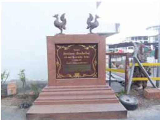
ป้ายโครงการของสะพานข้ามคลองแม่ข่า