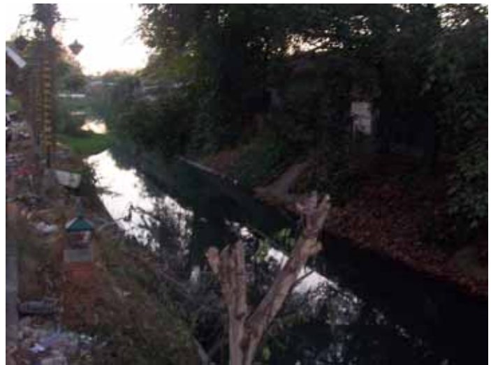
สภาพริมตลิ่งของคลองแม่ข่า