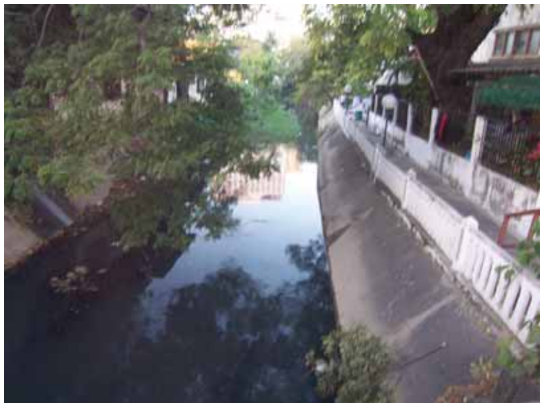
มุมมองอีกด้านหนึ่งของสะพาน