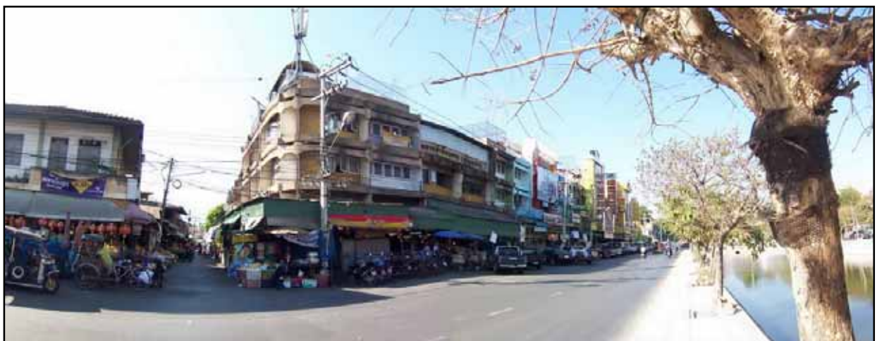
บริเวณหน้าถนนมูลเมือง ตลาดสมเพชรเป็นอาคารพาณิชย์ที่มีมานาน