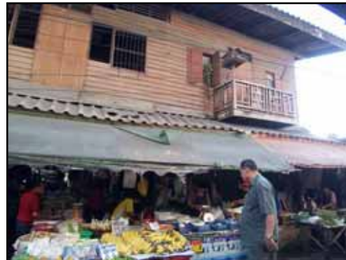
บ้านไม้กึ่งปูน