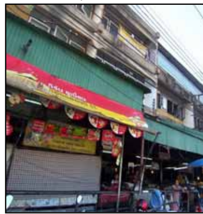
สภาพทั่วไปภายในตลาด ร้านค้าอยู่บริเวณด้านล่าง มีแผงป้องกันแดด อาคารหลายหลังเป็นแบบเก่าคารอนุรักษ์ไว้