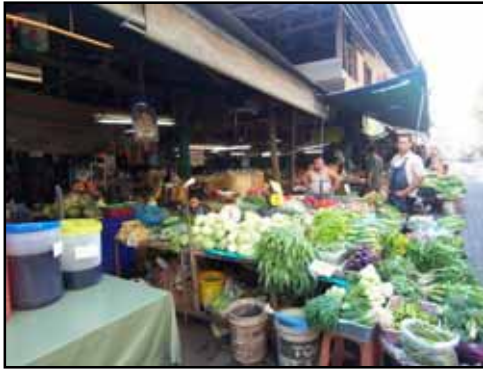
สินค้าส่วนใหญ่เป็นผักผลไม้สด