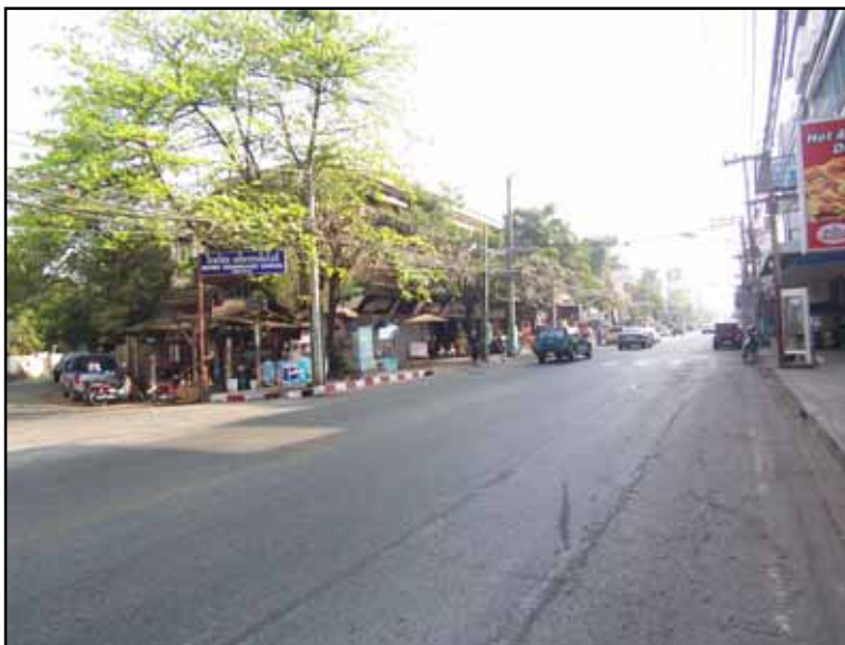
ถนนศรีดอนไชยขยายถนนเพิ่มจากเมื่อก่อนถนนเส้นเล็กและแคบ