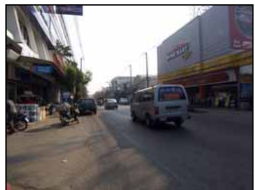
ร้านขายวัสดุก่อสร้างมีมากในย่านนี้