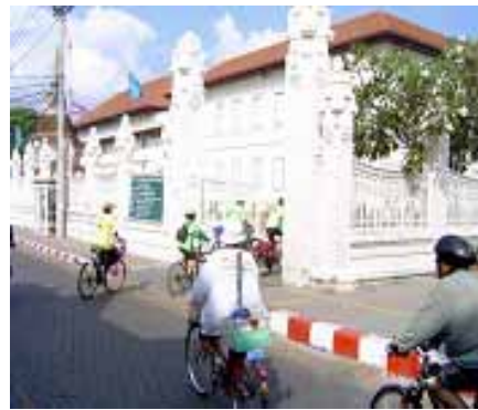
ทางเข้าด้านข้างที่ติดกับวัดสะดือเมือง