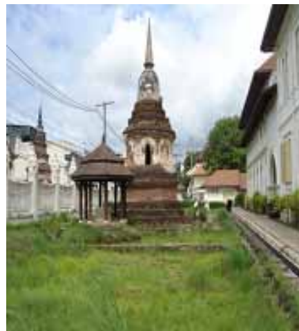
เจดีย์วัดสะดือเมืองภายในรั้วหอศิลปวัฒนธรรม