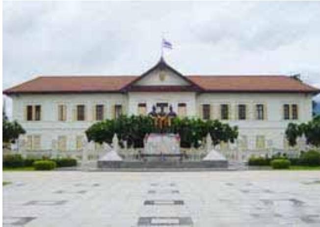
ลานบริเวณด้านหน้าหอศิลปวัฒนธรรม