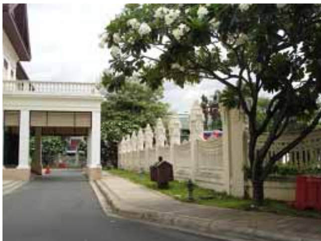
บริเวณภายในหอศิลปวัฒนธรรม