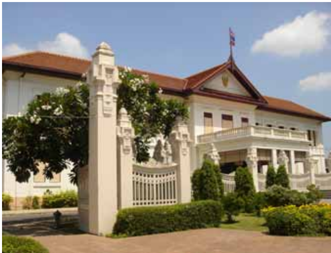
ทางเข้าจากด้านหน้า