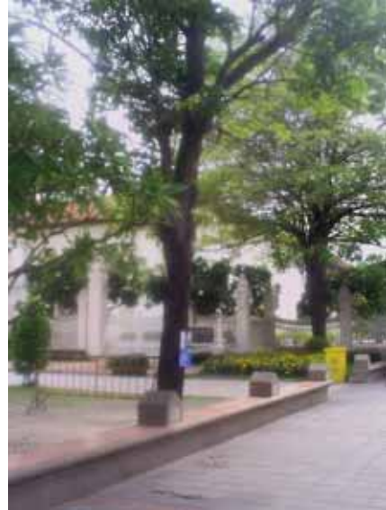
ทางเดินและม้านั่งด้านข้างลาน