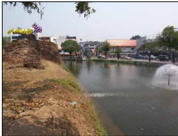
มุมมองจากแนวกำแพงเมืองด้านใน