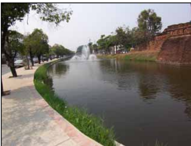
โดยรอบแจ้งมีการจัดภูมิทัศน์อย่างสวยงาม