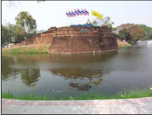
มุมมองจากนอกคูเมือง