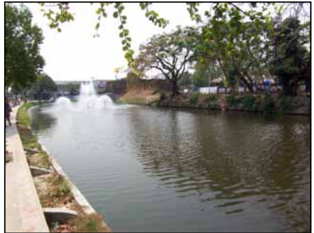
มีการตกแต่งภูมิทัศน์เพิ่มน้ำพุและปรับปรุงสภาพริมคูเมือง