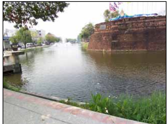
เทศบาลนครเชียงใหม่ได้ปรับปรุงทางเดินเท้า