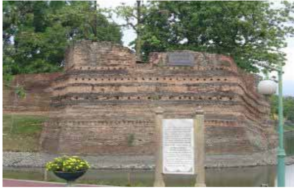
ด้านหน้าของแจ้งซึ่งมีข้อมูลประกอบ