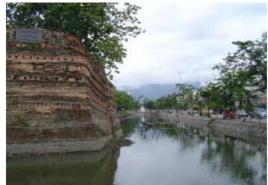
กำแพงถูกบูรณะให้อยู่ในสภาพดี