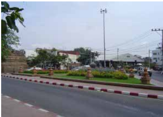
จัดช่องจราจรบริเวณใกล้เคียงมีการจัดสวน