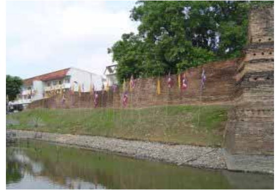
แนวกำแพงเก่าที่เลื้อยมาเชื่อมต่อกับแจ้ง