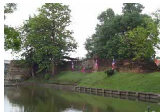
มุมมองจากวัดป่าเป้า