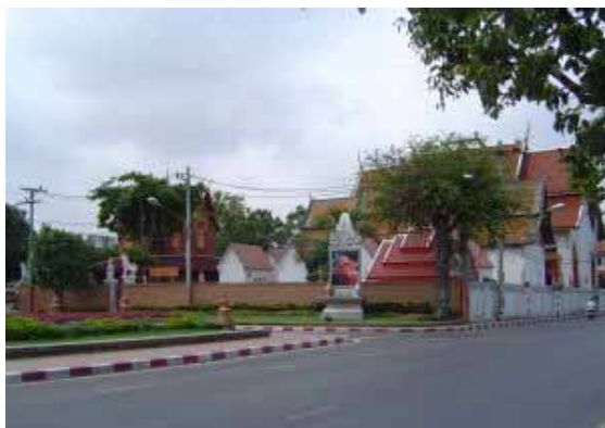
มุมมองจากแจ้งศรีภูมิออกไปเห็นวัดชัยศรีภูมิ