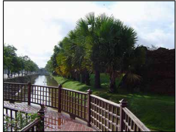
น้ำพุและแนวรั้วสร้างเพิ่มเติมเพื่อความงามและความปลอดภัยของผู้เดินเท้า