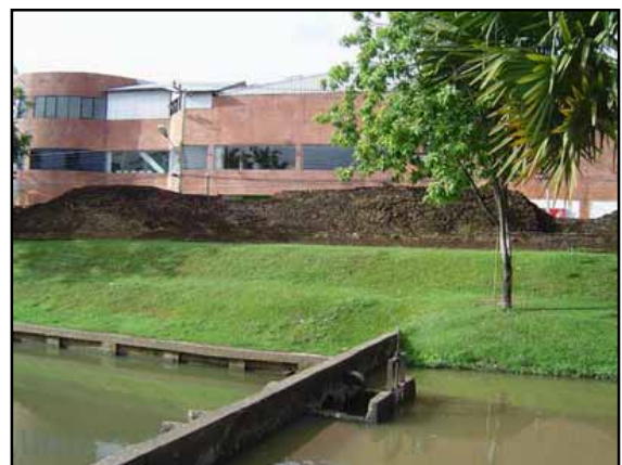
แนวกำแพงที่บดบังทัศนียภาพที่ไม่สวยงาม