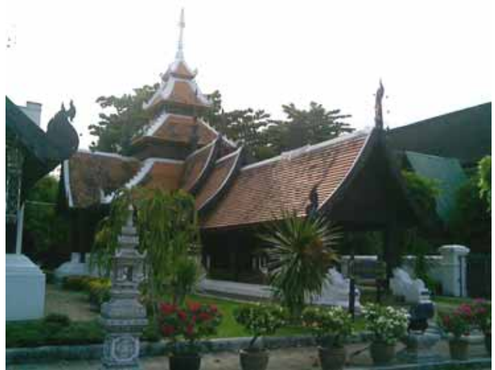
วิหารจตุรบูรพาจารย์