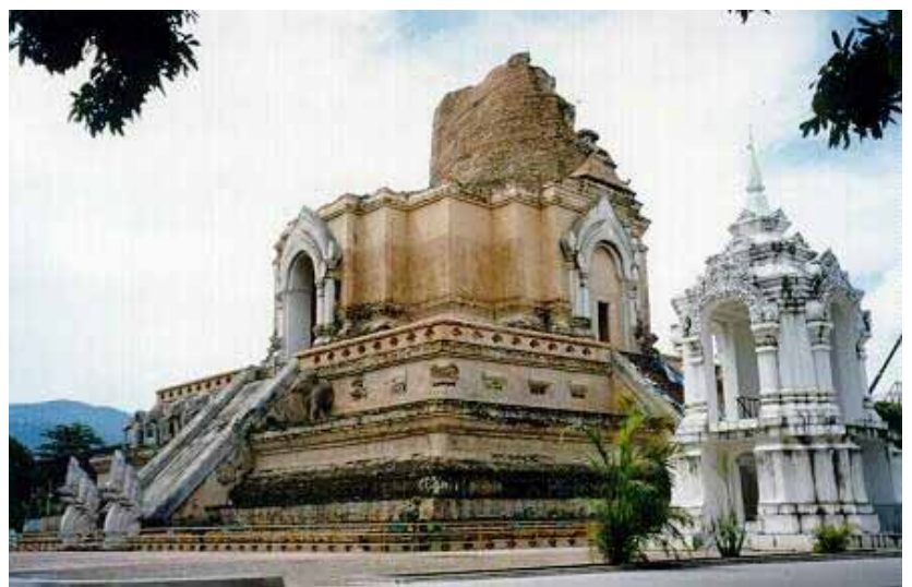
พระเจดีย์หลวง