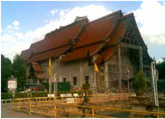
พระวิหารหลวง มีการบูรณะ