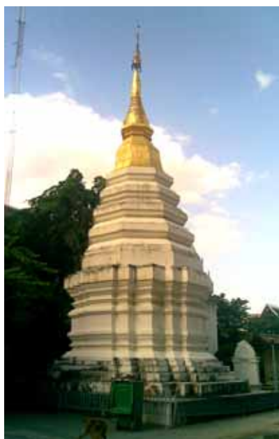
เจดีย์รายองค์เหนือ