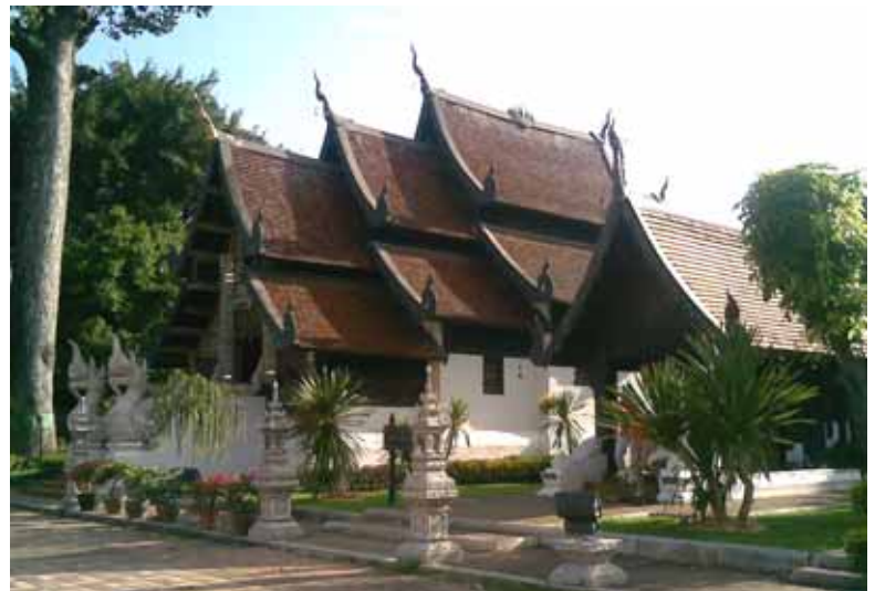
วิหารหลังใหม่