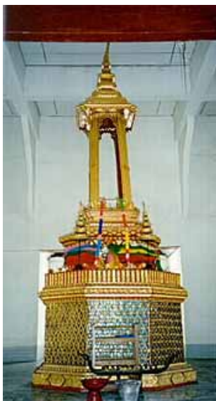
เสานทิชิล