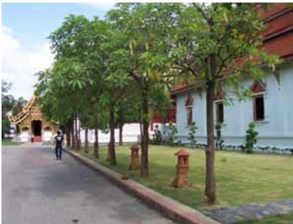
ทางเดินเข้ามวิหาร