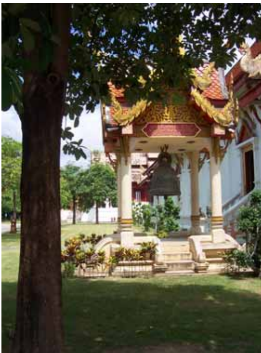
หอรระฆัง