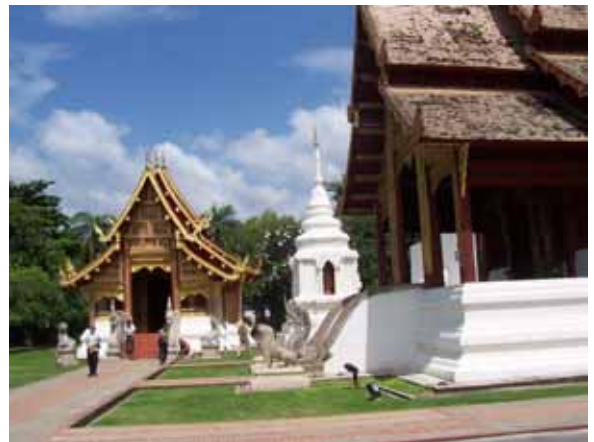
ด้านหน้าวิหาร