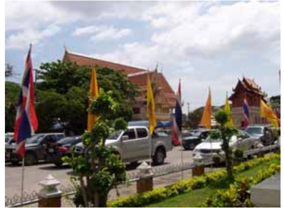
ลานจอดรถบริเวณวัด