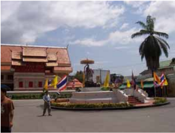
ด้านหน้าทางเข้าวัด