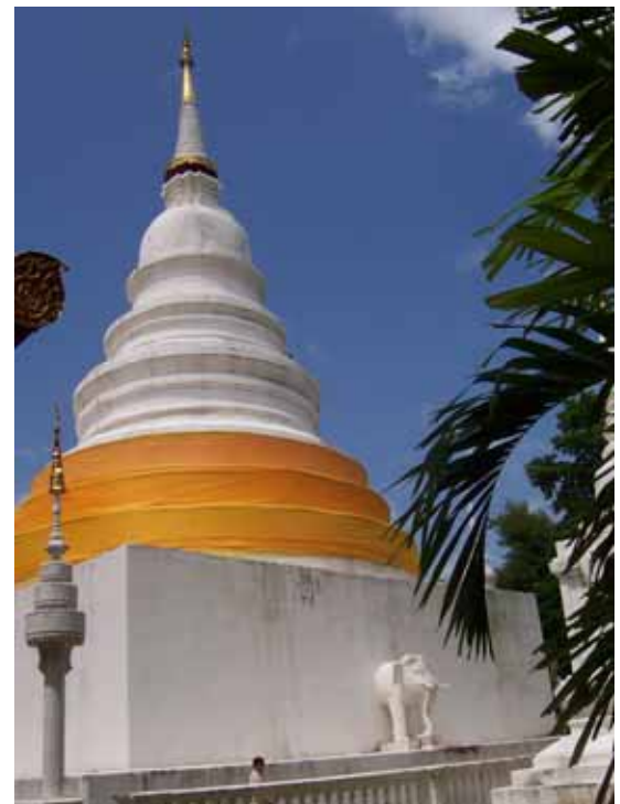
เจดีย์วัดพระสิงห์