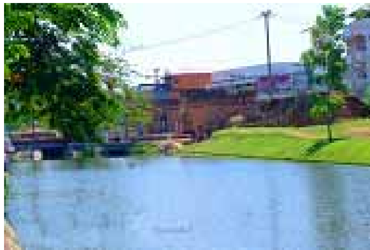
คูเมืองตรงประตูช้างเผือก