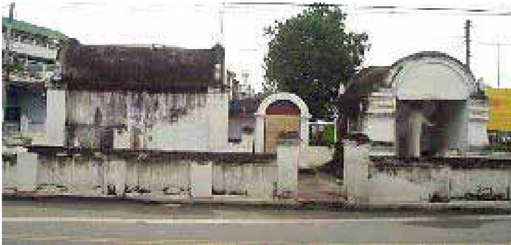
อนุสาวรีย์ช้างเผือก