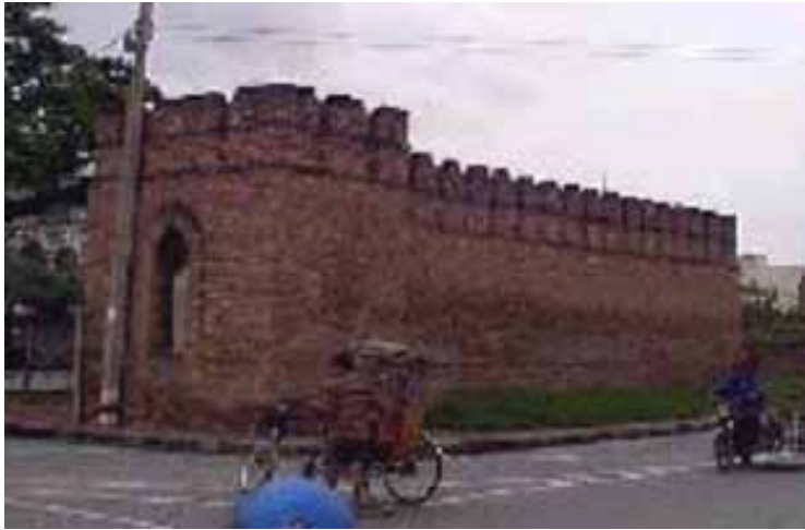
ประตูช้างเผือก