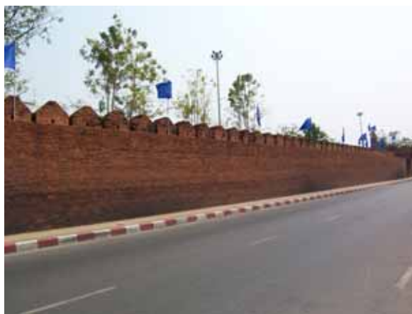
โบราณสถานใกล้กับถนนเป็นอย่างมาก