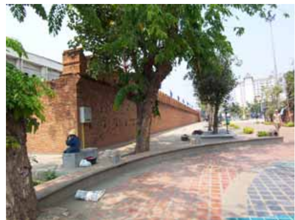
ในบริเวณลานมีการปรับภูมิทัศน์สม่ำเสมอ