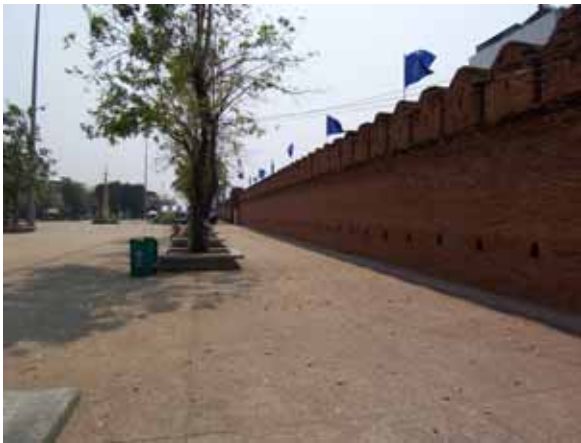
พื้นที่ส่วนใหญ่ใช้ทำกิจกรรมช่วงเช้าและเย็น