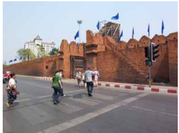
ด้านในกำแพง