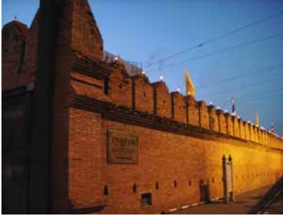
ประตูท่าแพยามกลางคืน