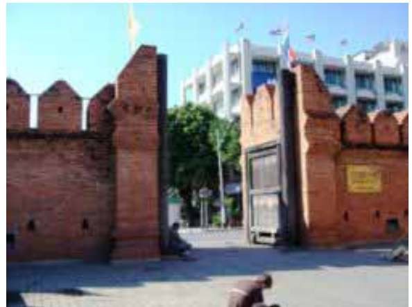
ประตูท่าแพถ่ายจากด้านหน้าเห็นประตูที่สมบูรณ์