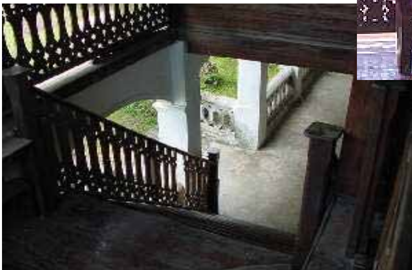
บรรยากาศของบันไดทางขึ้นค้ำบน