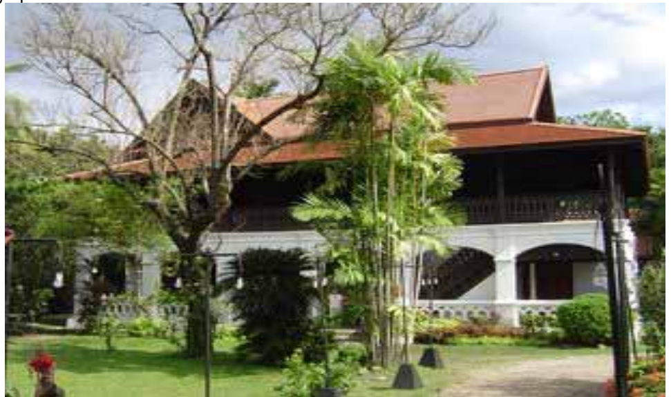
มุมมองจากทางเข้าของคุ้ม