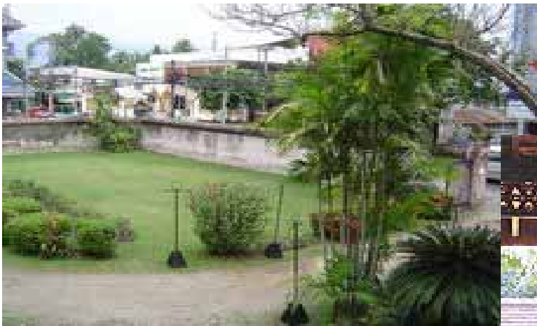
มุมมองจากค้ำบนตัวคุ้มมองเห็นสี่แยกกลางเวียง