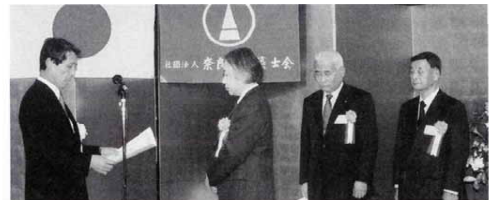
表彰式 平成17年(2005年)1月8日 奈良ホテル