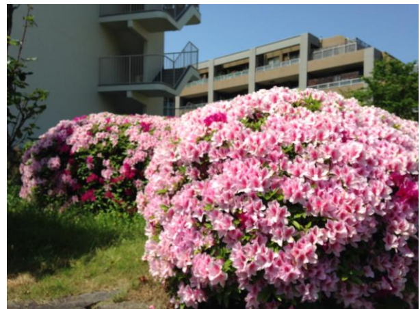
五月晴れに映えるツツジ 5/2