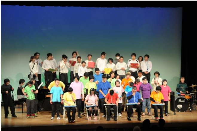
オープニング：ドレミの歌

今年は幸いお天気に恵まれ、例年以上のお客様においで頂き、盛会のうちに終えることができました。ありがとうございました。