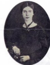
Emily Dickinson (1830～1886)

♪みなさま 一緒に歌いましょう♪ ラヴァーズ・レイン Lovers' Lane ～武蔵野の林の小径～